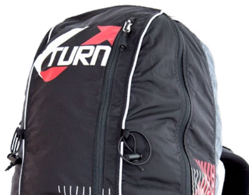
Material loops with elastic band, outside pocket with zipper. Materialschlaufen mit Gummizug, Außenfach mit Reißverschluss.